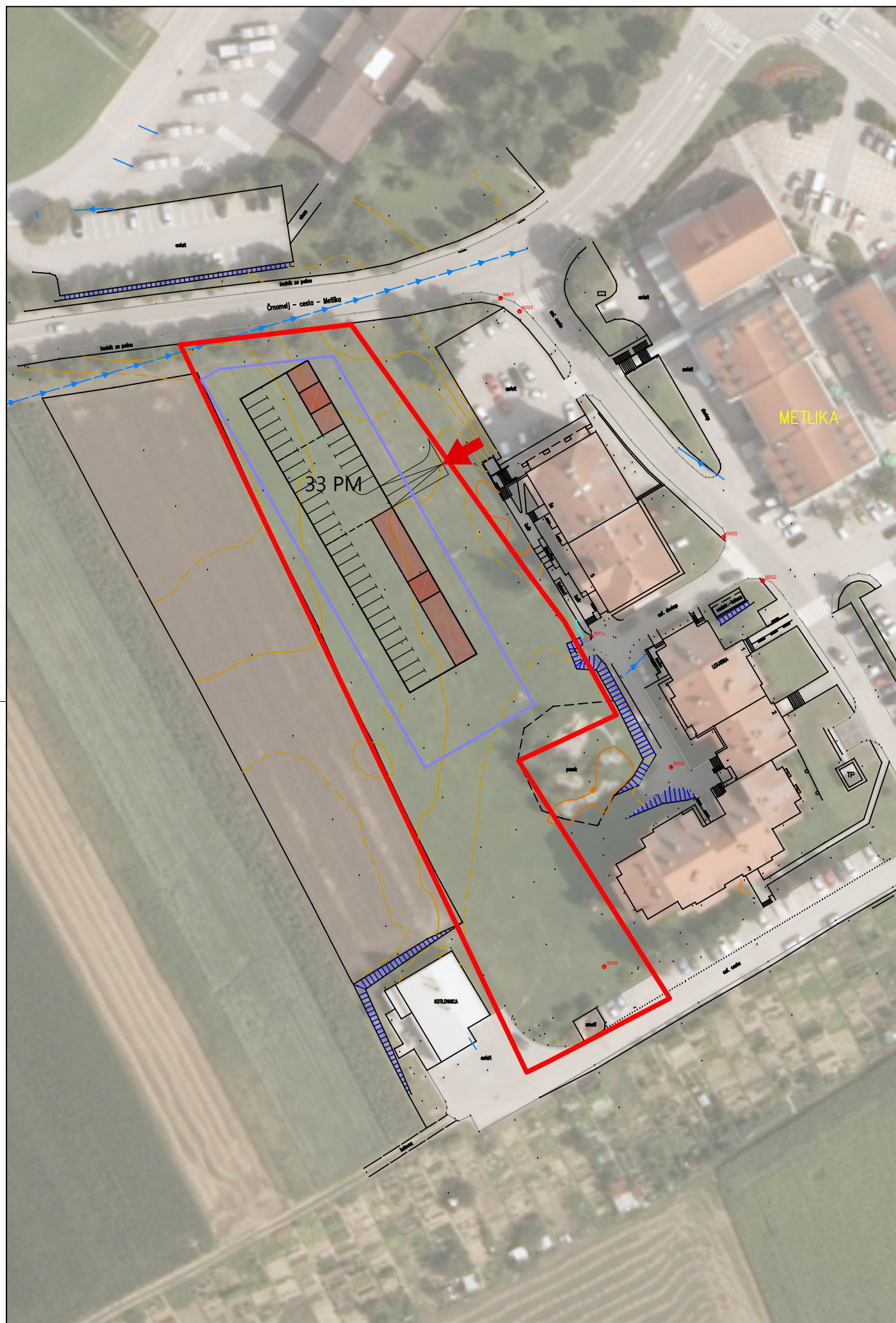
TLORIS KLETNE ETAŽE