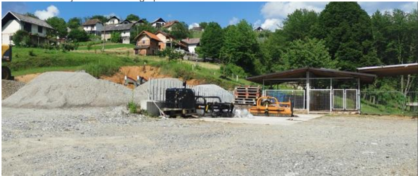
Trenutno stanje obravnavanega prostora

V postopku OPPN je za potrebe prvih naslednjih sprememb OPN, predlagana tudi sprememba podrobne namenske rabe iz K2 v IK.