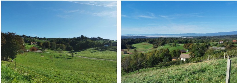
Pogledi na obravnavan prostor in predviden objekt

V postopku OPPN je za potrebe prvih naslednjih sprememb OPN, predlagana tudi sprememba podrobne namenske rabe iz K2 in Az v IK.